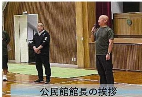
公民館館長の挨拶