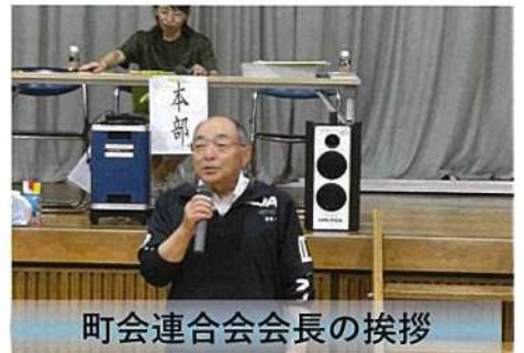
町会連合会会長の挨拶