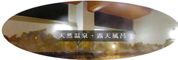
天然温泉・露天風呂